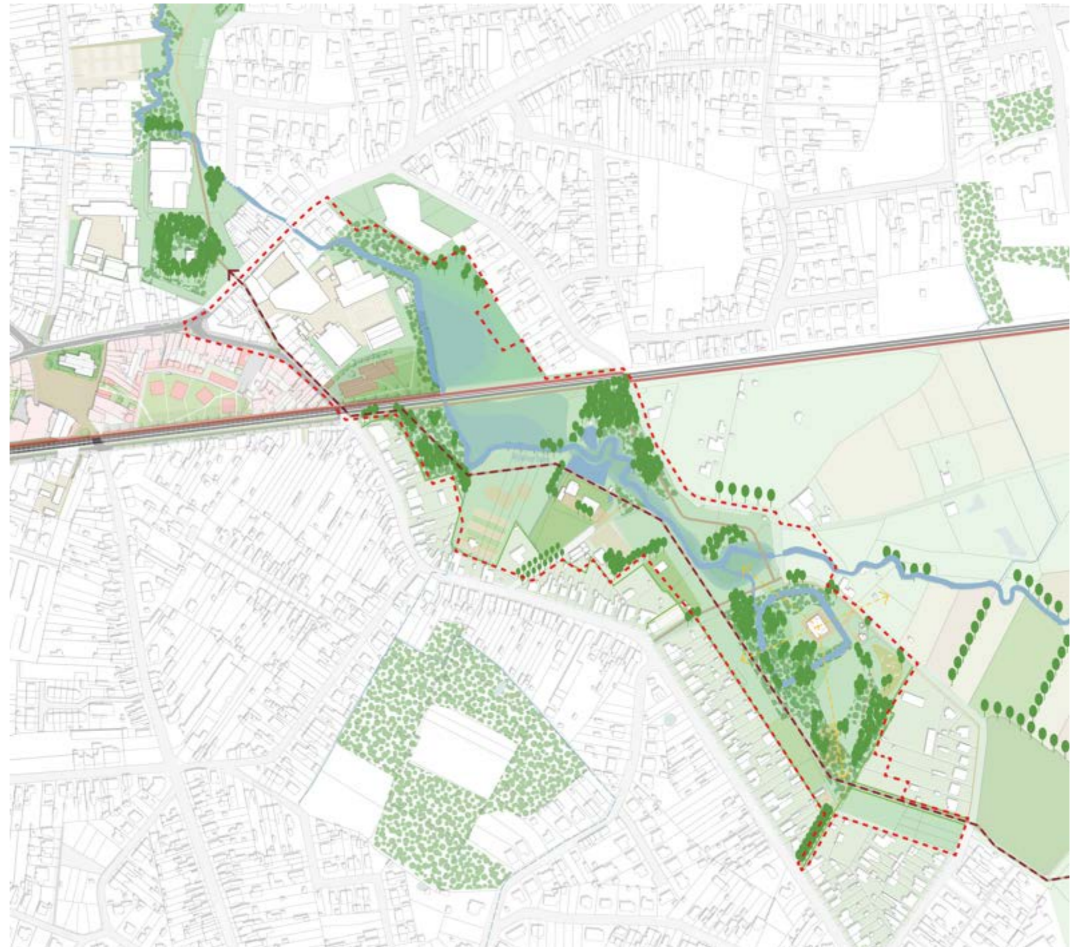
Masterplan Gemeente Nijlen - Openruimteperspectief - Beekpark zuid als dorpstuin met verbinding op grote schaal

Bestaande functies zoals Chiro Jong Leven en de hondenschool, maar evenzeer nieuwe functies zoals volkstuinjes krijgen hun plek in het Beekpark-Zuid. De 2 onderwijsites 'Tibourschrans' (academie) en 'githo nijlen' (middelbaar onderwijs) bevinden zich aan de randen van deze dorpstuin. Beide scholen kampen met uitbreidingsbehoeften. Binnen het project van de dorpstuin 'Beekpark-Zuid' zullen via ontwerpend onderzoek de potentiële uitbreidingen op de eigen terreinen bepaald moeten worden. Een afstemming en samenwerking tussen de twee scholen vormt een belangrijk uitgangspunt.