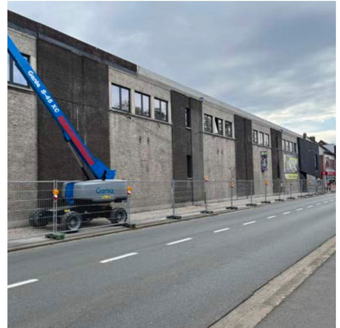
Githo vanuit het dorp gezien - Gemeentestraat