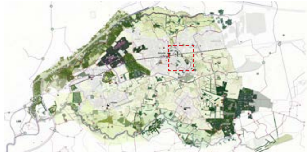
Masterplan Gemeente Nijlen - Openruimtetperspectief - Ambitie Noord Zuid verbinding voor recreatief netwerk

Voor de realisatie van het Beekpark-Zuid is daarvoor enerzijds een masterplan nodig waarbinnen de uitbreidingsbehoeften voor de twee scholen (Githo Nijlen en academie Nijlen) een plaats krijgen, en anderzijds een landschapsonwerp/inrichtingsplan voor het Beekpark-Zuid.