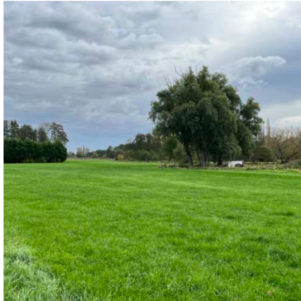
Landschap - Nijlense beek

Voor de realisatie van het Beekpark-Zuid is daarvoor enerzijds een masterplan nodig waarbinnen de uitbreidingsbehoeften voor de twee scholen (Githo Nijlen en academie Nijlen) een plaats krijgen, en anderzijds een landschapsonwerp/inrichtingsplan voor het Beekpark-Zuid.