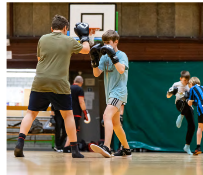
SPORTEN 'NA DE BEL'