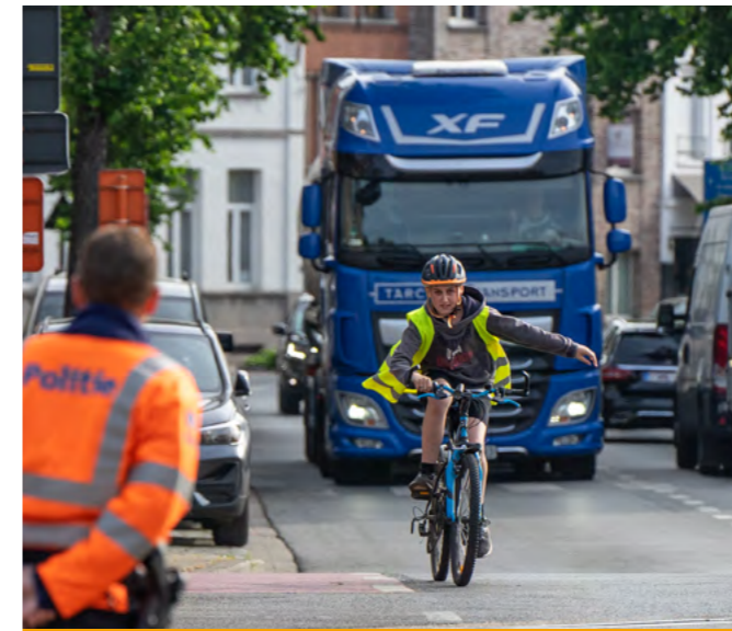
HET GROTE FIETSEXAMEN

Duurzaamheid en milieubewustheid willen we ondersteunen via milieulessen, actie 'Proper Nijlen', organisatie van de Week van de Bij en de kennismakingsdag met onze lokale land- en tuinbouw, ... Er is ook aandacht voor solidariteit met ontwikkelingslanden via de scholenslotdag van het Nijlens comité voor ontwikkelingsamenwerking.