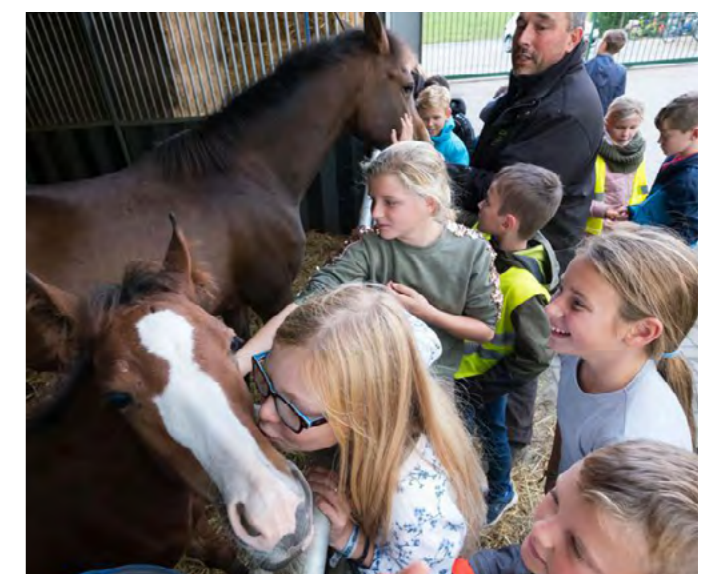
KENNISMAKING LOKALE LAND- EN TUINBOUW